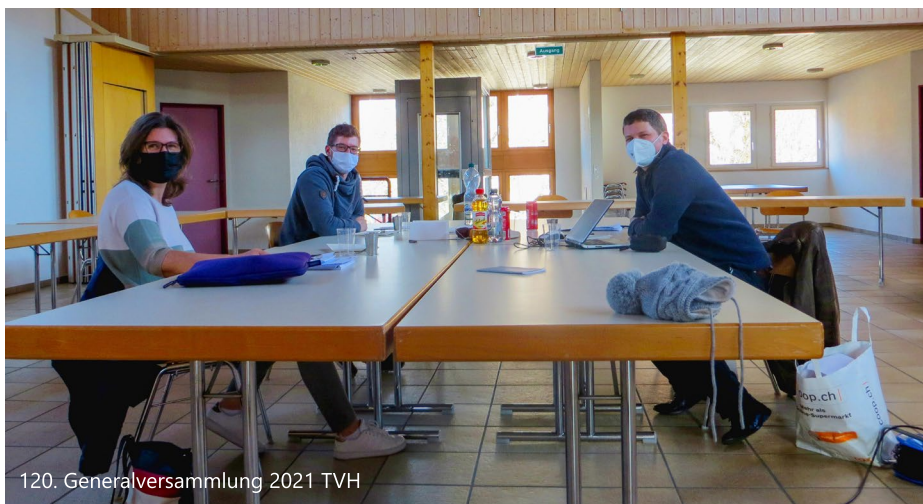
120. Generalversammlung 2021 TVH