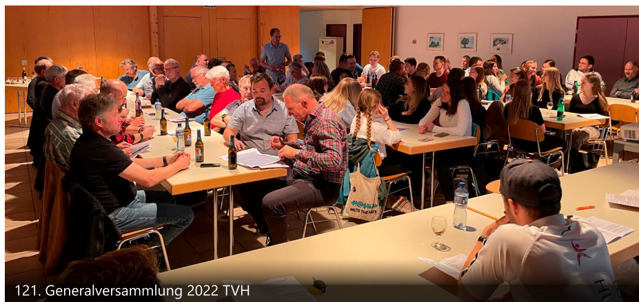
121. Generalversammlung 2022 TVH