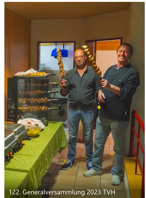
122. Generalversammlung 2023 TVH

Eine Woche später, am 18./19. November, startete die Jugi in den letzten Anlass des Jahres, die Abendunterhaltung unter dem Motto «Voll Verkatert». Die Montags-Jugi trat mit dem Thema «Kofmehl Gentediaare» auf, die Mittwochs-Jugi mit dem Motto «Festzelt». Die Trainings zahlten sich aus und die beiden Vorführungen wurden mit grossem Applaus belohnt. In den Pausen waren alle sofort bei den Lössli und verkauften diese begeistert in der gesamten Halle. Im Jugi-Raum wurde