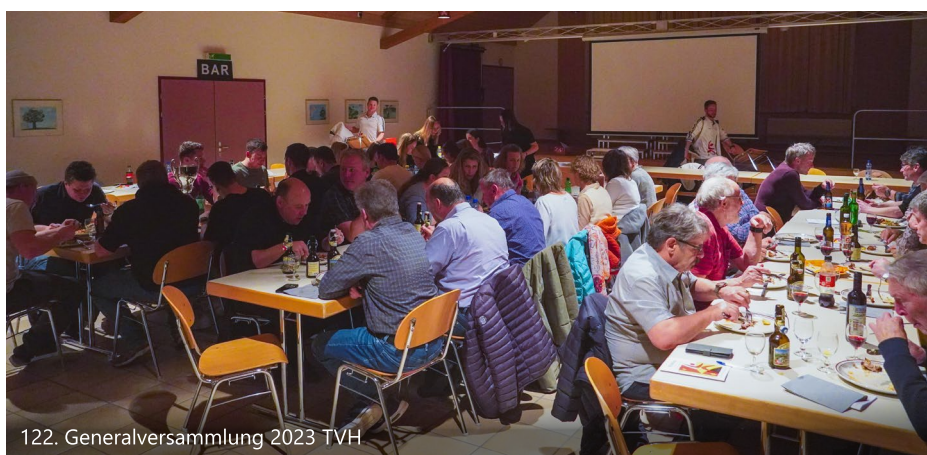
122. Generalversammlung 2023 TVH

Nach einer Sommerpause folgte kurz darauf ein weiterer Höhepunkt. Das Waldfest lockte wieder zahlreiche Besucher an. Am Freitag mit den Backgroundgamblers, am Samstag mit «hauseigenem» Karaoke, wo sich das eine oder andere versteckte Talent entpuppte. Dieses Jahr fand neu das Waldfest mit einem Waldsporttag für die Kleinen (Jg. 2010 und jünger) statt. Dieser erwies sich als voller Erfolg. Nicht nur die Kleinen erfreuten sich an den spielerischen Disziplinen im Wald, sondern auch die Erwachsenen am gemütlichen Beisammensein und Aebi's berühmt-berüchtigtem Risotto.