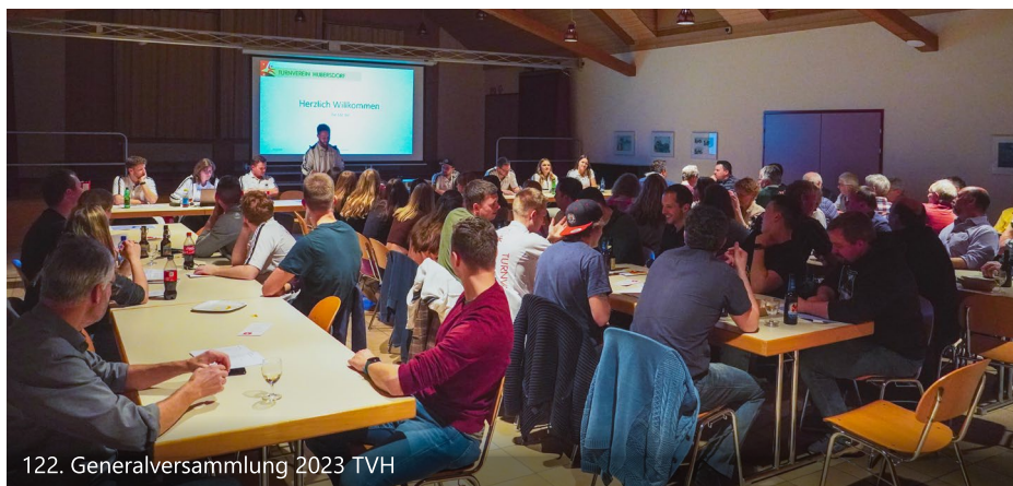
122. Generalversammlung 2023 TVH