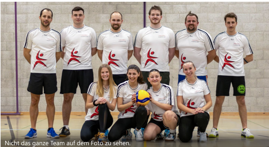
Nicht das ganze Team auf dem Foto zu sehen.