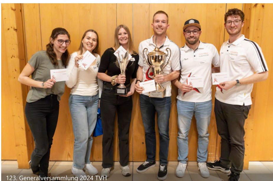
123. Generalversammlung 2024 TVH

An dieser Stelle gebührt den Jubilaren ein grosses Dankeschön für die Organisation und den leckeren Brunch im Sennhaus!