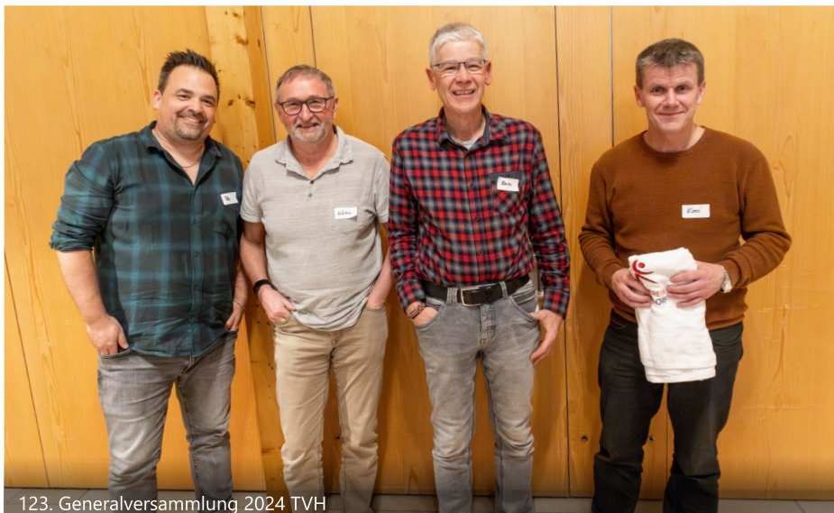
123. Generalversammlung 2024 TVH

Am Samstag, 2. September wurden wir von den Jubilaren mit dem alljährlichen Ausflug überrascht. Am Morgen starteten wir mit dem Bippelisi Richtung Weissenstein, unserem ersten Tagesziel. Nach einer reichhaltigen Stärkung im Restaurant Sennhaus ging unsere Wanderung weiter auf den Grenchenberg. Dort wartete, nach 1-2 Trinkstopps, am Abend ein leckeres Nachtessen auf uns. Mit dem Daybus gings schliesslich wieder zurück nach Hopperschte.