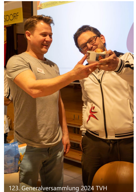
123. Generalversammlung 2024 TVH

Nun hat ja das neue Jahr schon begonnen und die Gedanken schweifen schon etwas