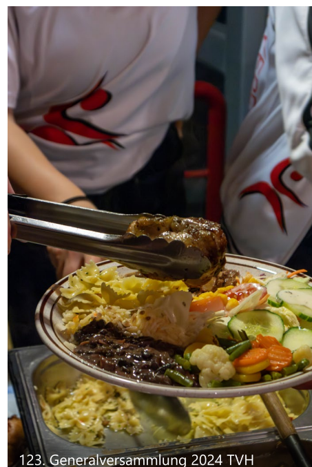
123. Generalversammlung 2024 TVH